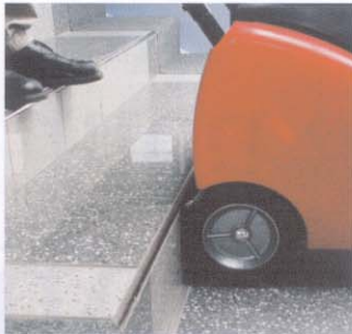
Transport facile dans les escaliers