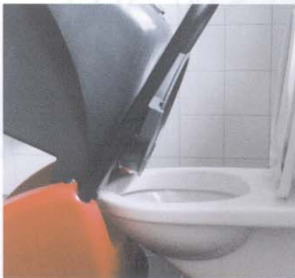
Vidage basculant pratique