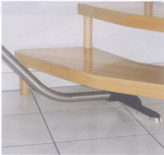
Le tuyau courbé, un avantage pour aspirer sous les escaliers etc.