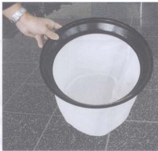
Filter nylon pour aspirer à eau et sec