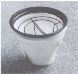
Filter à grande surface