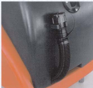
Vidage de l'eau sale est possible avec le tuyau