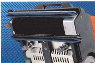
RA 400 E: Suceur-double relevable