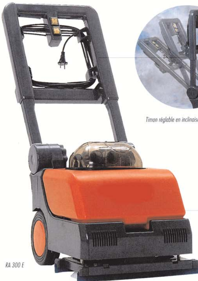
RA 300 E