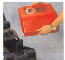
RA 300 E: Réservoir amovible