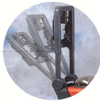
Timon réglable en inclinaison et en hauteur