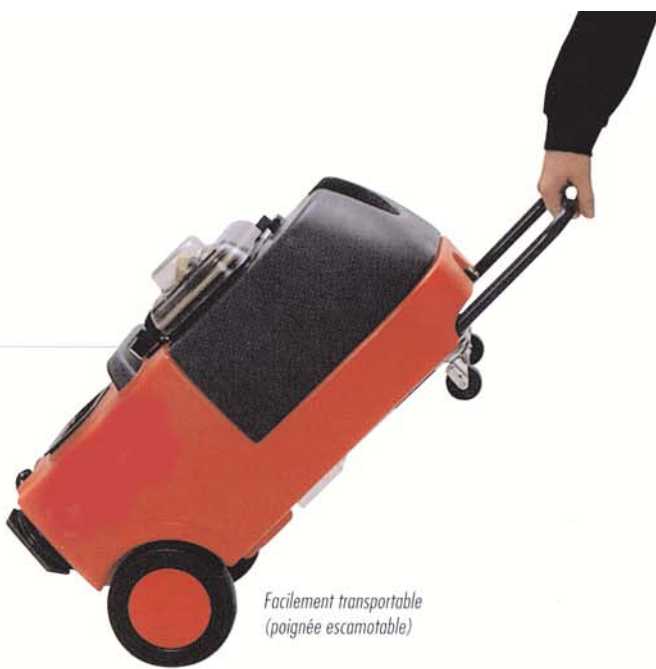
Facilement transportable (poignée escamotable)