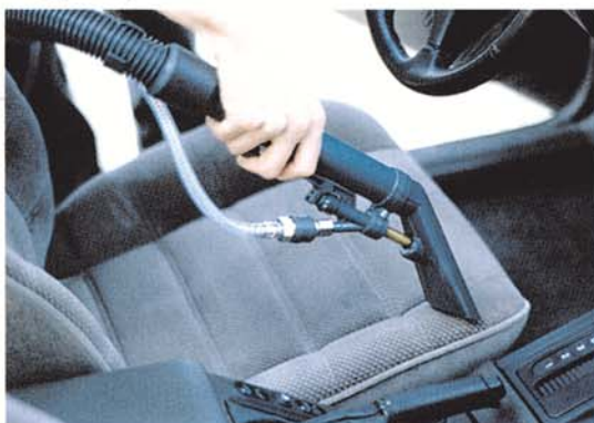
Nettoyage de siège de voiture