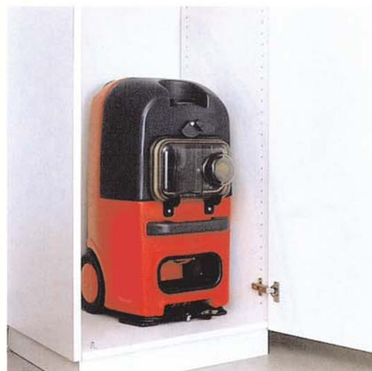
Encombrement minimum (largeur 36 cm)