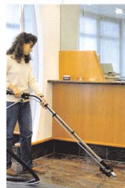
Nettoyage des sols durs