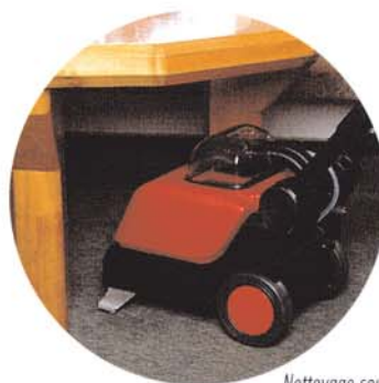
Nettoyage sous les tables et chaises