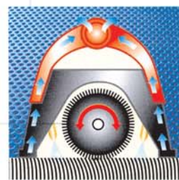
TW Compact: mouillage, brossage et aspiration dans les deux sens