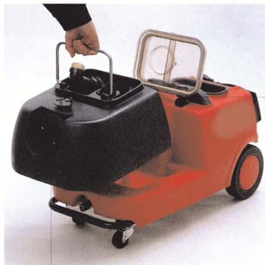
Réservoir d'eau sale amovible