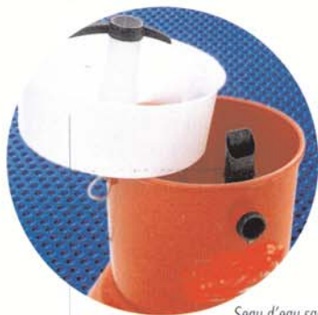
Seau d'eau sale amovible