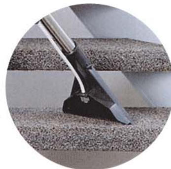
TW 383/TW Compact Le kit de lavage permet de nettoyer efficacement sous les meubles, escaliers...

Pour le nettoyage rapide et facile des moquettes grâce à l'action mécanique d'une brosse oscillante.