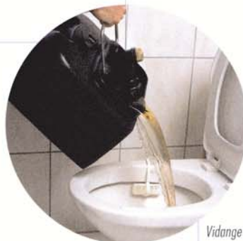
Vidange de l'eau sale