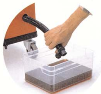
Vidange de l'eau sale