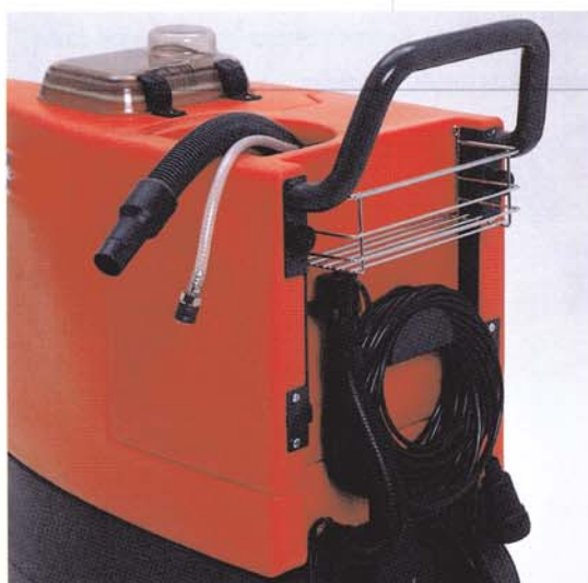
Transport aisé des accessoires