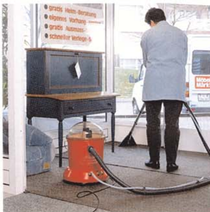
Très simple à utiliser