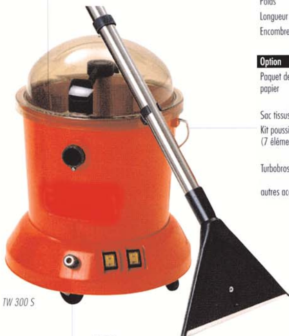
TW 300 S