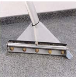
Balai 40 cm, 5 gicleurs