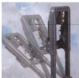
Timon réglable en inclinaison et en hauteur