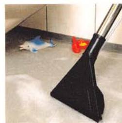
aspiration d'eau zésiduelles

Avec ses nombreux accessoires optionnels il nettoie moquettes, tapis et textiles d'ameublement (fauteuils...). Il lave les sols durs et peut même aspirer l'eau et la poussière.