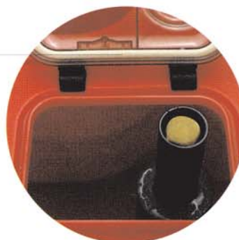
Accès facile au réservoir d'eau sale