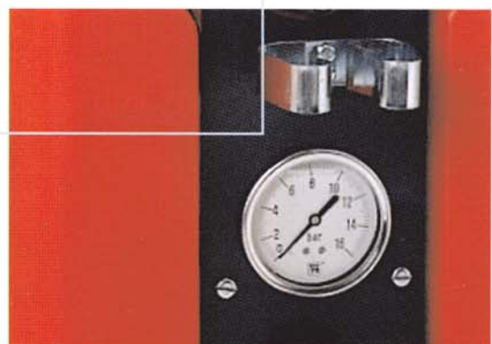
TW 1250: pression réglable de 2 à 11 bars

Fabriqués avec soin par cleanfix, ces deux modèles sont étudiés pour travailler dans les meilleures conditions même sur les chantiers les plus difficiles.