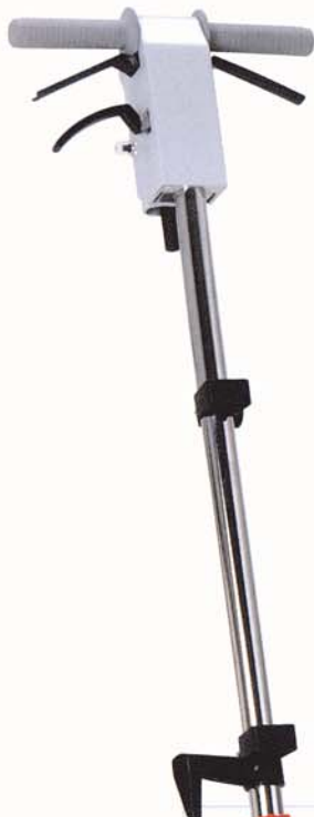
G 43-175 (Abb. ohne Laugentank)