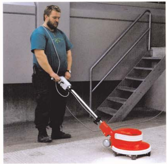
G 43-145 Steinschleifen