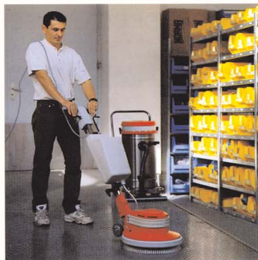
G 43-175 Noppenbodenreinigung