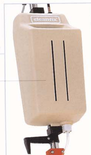
Laugentank als Zubehör