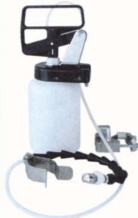
Sprühgerät (Spraymaster) 1 Liter