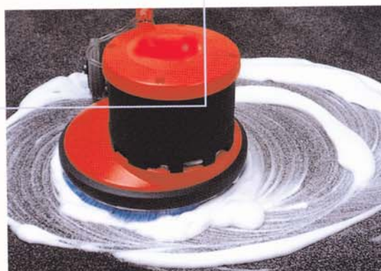
R 44-180 Teppichreinigung

Die professionelle Wahl für stärkste Verschmutzungen. Für die Grund- und Unterhaltsreinigung von wasserbeständigen Böden. Besonders lauffähig dank Poly-V-Riemen-Antrieb. Leicht führbar und optimal ausbalanciert dank aus der Mitte versetztem Motor.