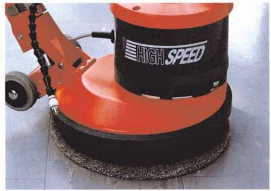
R 44-450 Sprayreinigung