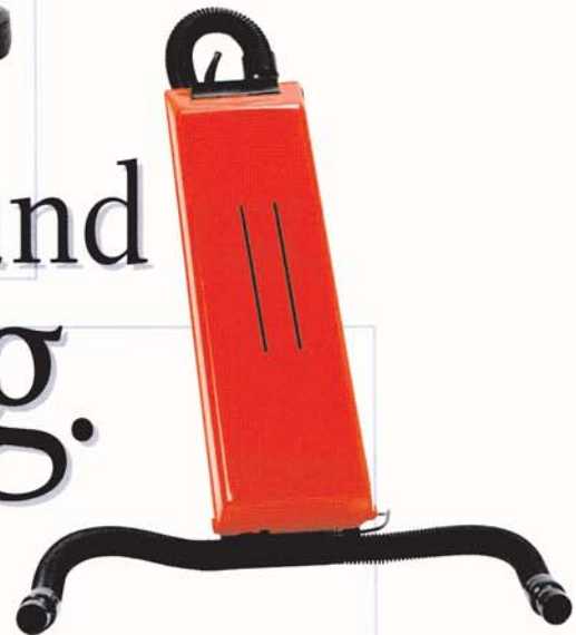
Absaugvorrichtung zu R 44-450 und R 53-1100