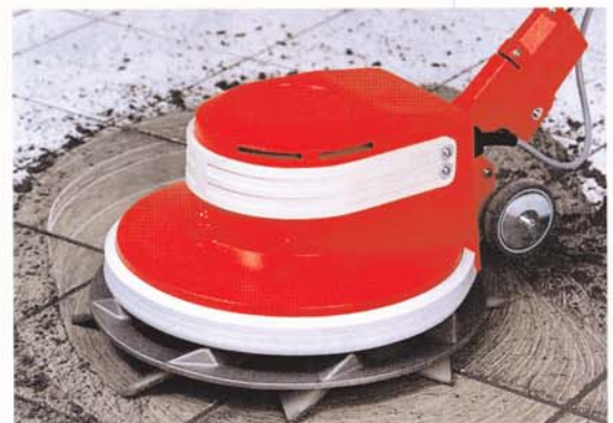
G 43-145 Ausfugen