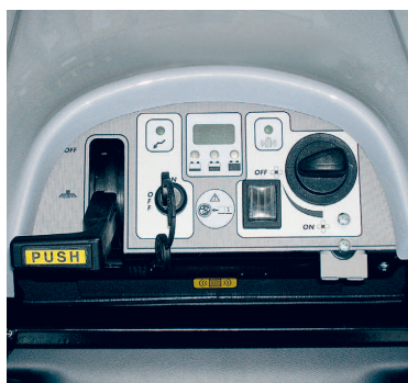
Panneau de commandes facile à utiliser et intuitif