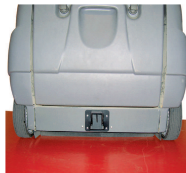
Frein de stationnement pour une sécurité maximale