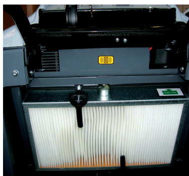
Secoueur de filtre électrique (option)